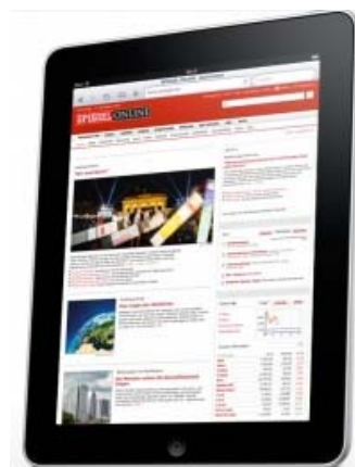
Alle wollen das iPad

Am 28. Mai startet der Verkauf des iPad in Deutschland. Das Medieninteresse ist riesig, keine Wunder also, dass fast jeder Deutsche den neuen Tablet-Computer von Apple kennt. Dies ergab eine Befragung der Marktforschung Puls . Demnach haben 90 Prozent der Befragten schon einmal etwas vom iPad gehört. Ein Drittel davon kann sich sogar vorstellen, das iPad zu kaufen.